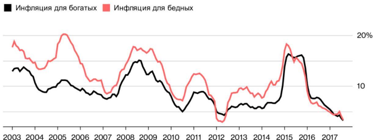
Рис. 2. Влияние инфляции на разные социальные слои общества [4]

корзины для обеспеченных и социально ориентированных членов общества (рис.2).