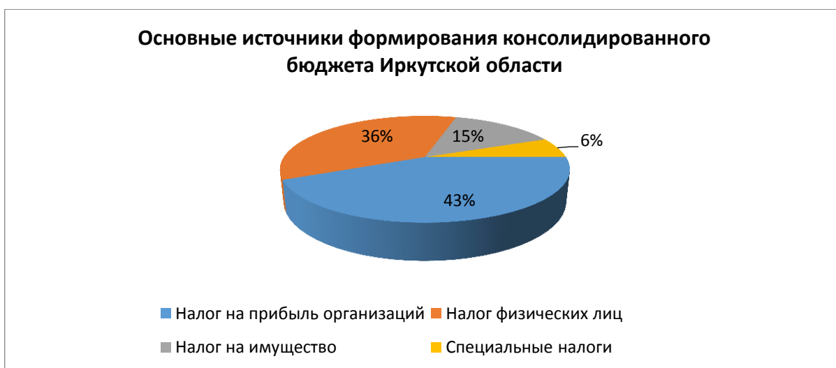
Рисунок 1. Основные источники формирования консолидированного бюджета Иркутской области в 2016-2017 гг.

Платежи налога на прибыль организаций выросли более чем на 7 млрд рублей или в 1,4 раза по сравнению с 2016 г. Прирост поступлений приходится на структурные подразделения, головные организации которых находятся за пределами Иркутской области — 5 млрд рублей. На рост поступлений (2 млрд рублей) повлияли и нефтедобывающие предприятия, состоящие на учете в инспекциях региона, вследствие роста цены на нефть и объемов добычи (Рис. 2).