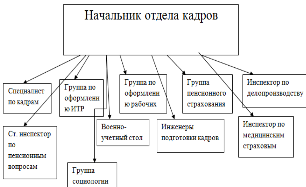
Рисунок 2. Структура отдела кадров АО УАП Гидравлика

Структура отдела кадров АО УАП Гидравлика представлена на рисунке 2.