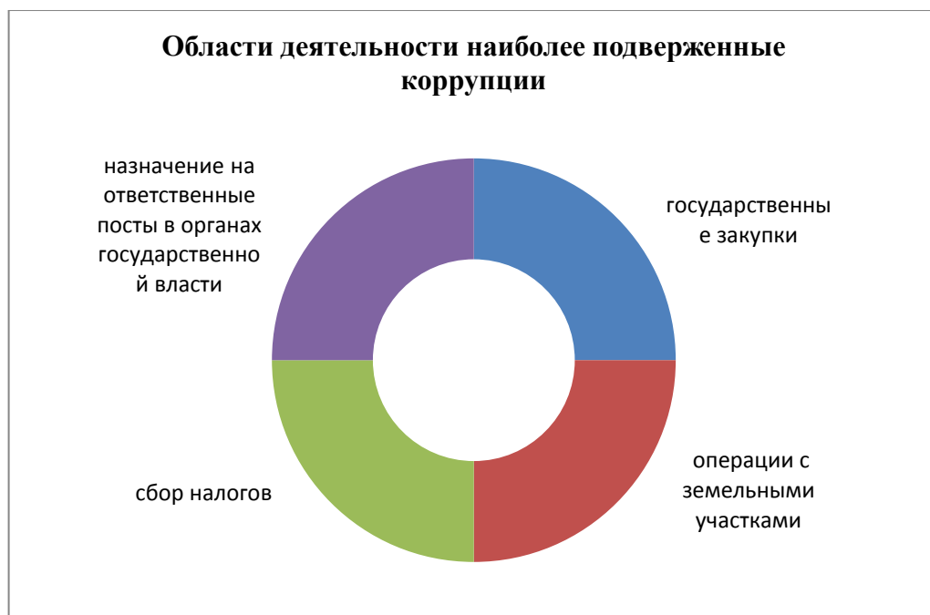
Рисунок 1 – Области деятельности наиболее подверженные коррупции.

Наглядно области деятельности, наиболее подверженные коррупции, изображены на рисунке (рисунок 1). [1, с.45]