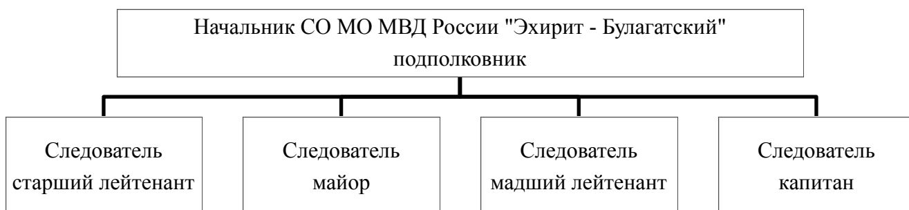
Рис. 2. Структура управления СО МО МВД России «Эхирит-Булагатский»

На рисунке 2 рассмотрим более подробно структуру управления следственного отдела МВД России «Эхирит-Булагатский».