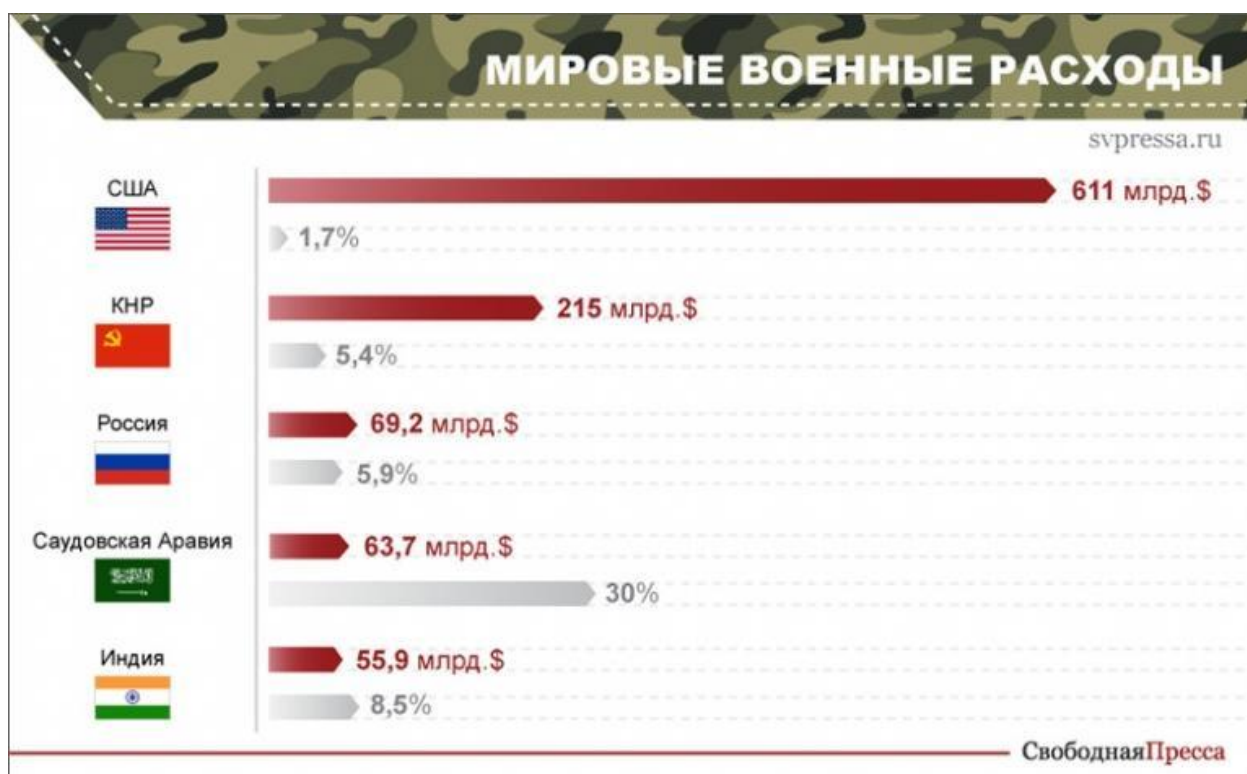
Рис. 9. Расходы на ВПК мировые рейтинги [1]

Здесь показатели точно не печальные, Россия входит в топ-3 стран, конечно нам далеко до «мирового гегемона» и «мировой фабрики», но тем не менее в условиях того, что экономика нашей страны развивается это очень хорошие показатели.