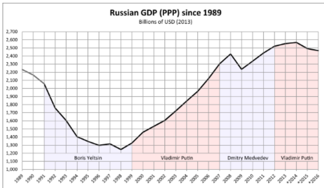
Рис. 1. График показателя ВВП РФ, начиная с 1989г

вводятся Западом, внутренний рынок, не смотря на все усилия правительства все еще слаб.