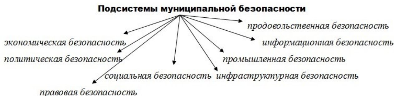
Рис. 2. Подсистемы муниципальной безопасности

Подсистемы муниципальной безопасности взаимосвязаны и дополняют друг друга. Что касается методов расчета уровня экономической безопасности территорий, то, как показали исследования, сегодня в зарубежной и отечественной науке и практике нет общепризнанного универсального метода диагностики уровня экономической безопасности территории [4].