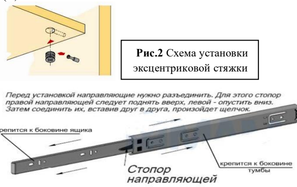
Рис.3 Схема установки шариковых направляющих