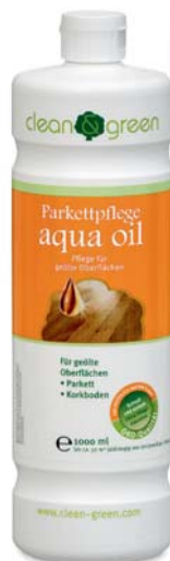
Средство по уходу за паркетным полом aqua oil

Для обновления/восстановления подвергнувшегося сильной нагрузке темного паркета с пропиткой маслом мы рекомендуем использовать средство aqua oil black. Для белого паркета с пропиткой маслом рекомендуется средство aqua oil white.