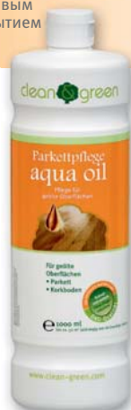
Средство по уходу за паркетом aqua oil