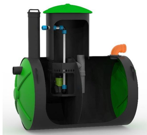
Принудительное водоотведение (с емкостью для насоса и трубой для откачки)