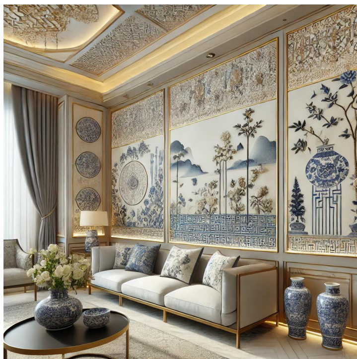
Рисунок 2

жат не только декоративными элементами, но и, благодаря своим художественным символам, наделяют пространство ощущением истории и памяти местной культуры.