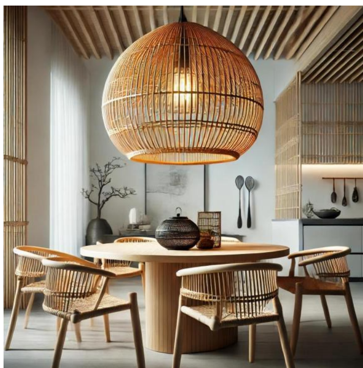
Рисунок 3

от статической демонстрации к динамической передаче для усиления её жизнеспособности. Трансформация НКН в современном интерьерном дизайне больше не ограничивается такими конкретными пространствами, как музеи или выставочные залы, а проникает в повседневную жизнь. Например, сочетание традиционного искусства плетения из бамбука с современным дизайном интерьера не только сохраняет НКН, но и создает динамическую цепочку культурной коммуникации через использование в быту. Пользователи, взаимодействуя с такими элементами, могут осознать ценность традиционных ремесел, что способствует более глубокому пониманию и признанию культуры.