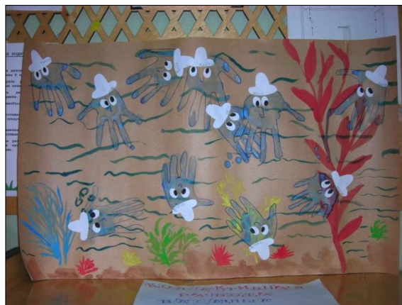
Коллективная работа первой младшей группы «Веселые осьминожки»