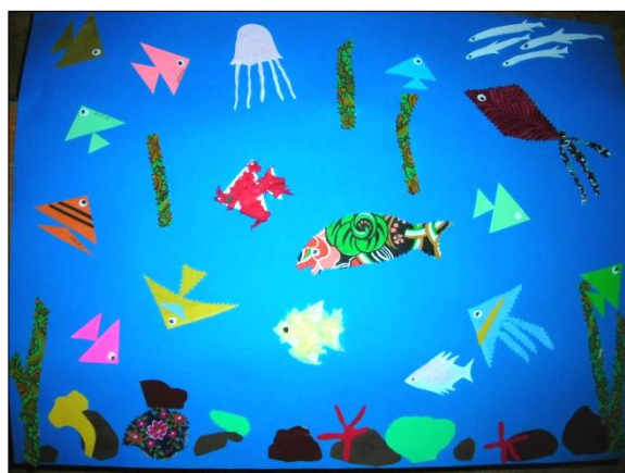
Коллективная работа первой и второй младших групп «Теплое море»