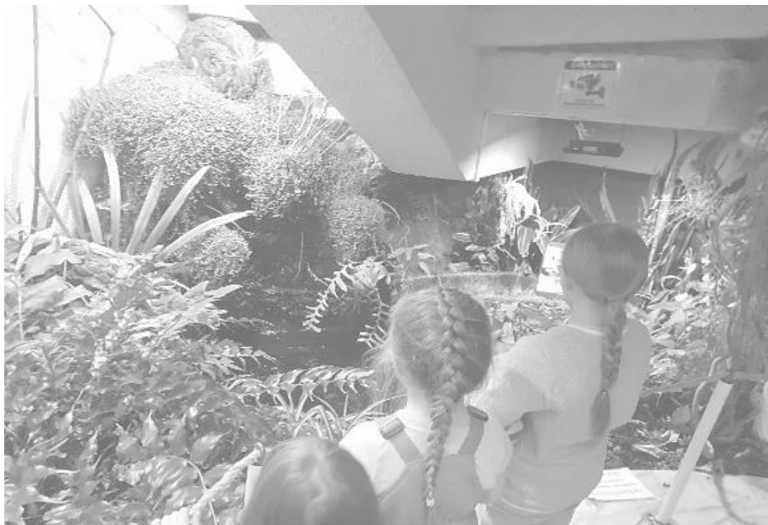
Рисунок 2. МАУ ДО «ДПиШ им. Н.К. Крупской г. Челябинска»

Центр детский экологический г. Челябинска и ГБУ ДПО «ЧИРО» оказывают методическую и консультативную помощь педагогическим кадрам по направлению.