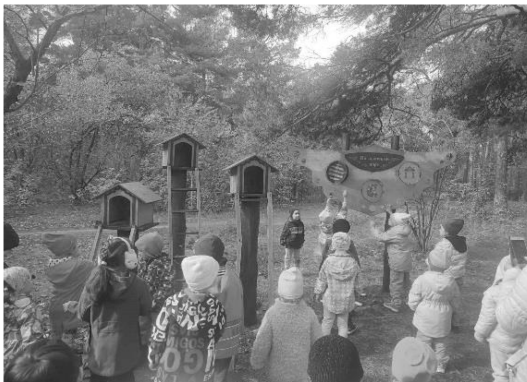
Рисунок 1. Городской парк им. Ю. Гагарина

рые требуют постоянного обновления и совершенствования профессионально значимых качеств личности, профессиональной компетентности педагогов в сфере организации экологического образования дошкольников. Понимая под «экологической компетентностью» педагога дошкольного образования «интегративное качество личности, которое включает в себя знания, умения и убеждения экологической направленности, а также личностные качества, которые позволяют эффективно проектировать и осуществлять экологическое образование дошкольников» (О.Г. Роговая), мы говорим о способности педагогов не только донести знания об окружающем мире природы до дошкольников, но и способности научить детей навыкам принятия экологически целесообразных решений в конкретных ситуациях.