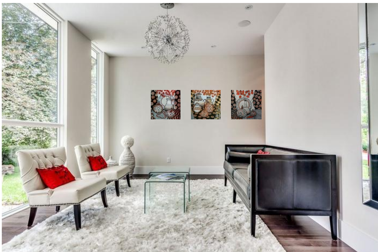
Рисунок 2. Творческий проект

и места преломления формы обведены черными или темными линиями. Таким образом, созданы четкие абрисы и границы между композиционными пятнами. Рассматривая творческий проект «Осень», бакалавры пришли к выводу, что работа, выполненная в такой технике, получается очень зрелищной.