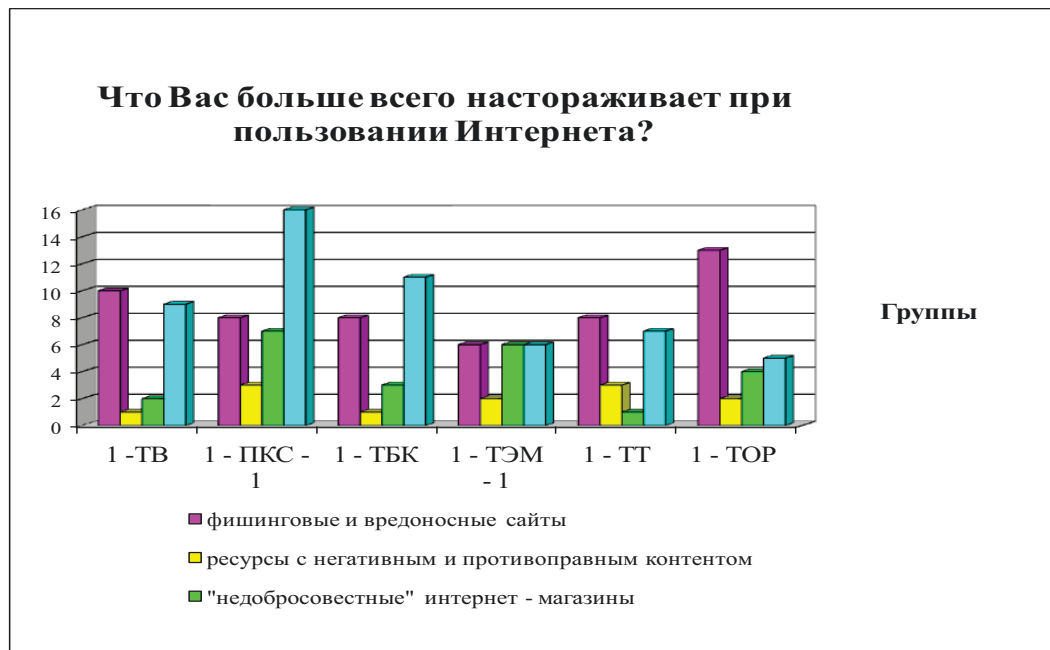
Рисунок 1. Слайд из презентации к конференции – опрос первых курсов

11. Ну и напоследок пробежитесь по форумам, почитайте, что пишут о компании, к услугам которой вы собираетесь прибегнуть [1].