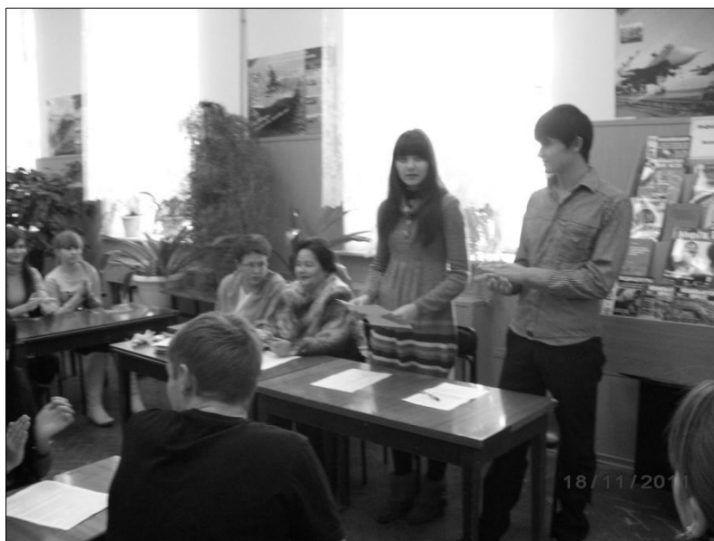
Ведущие конференции студенты группы «3 м»