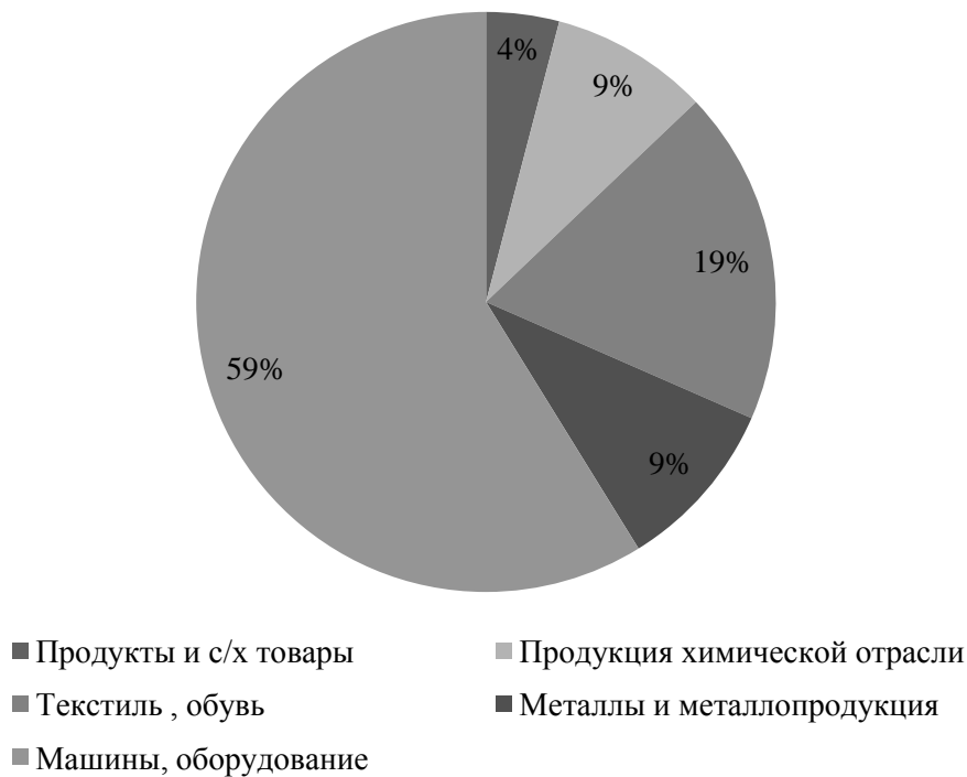
Рисунок 2. Структура импорта на октябрь 2018 г.

Согласно показателям в 2016 г. объем оборота между Россией и Китаем составил почти 70 миллиардов долларов. Период с января по апрель 2018 г. данный показатель уже превышал отметку в 24 миллиарда и не прекращал свое движение, что говорит о стабильном росте торговых отношений [2].