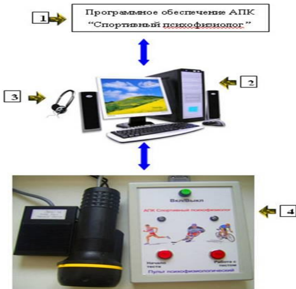
Рисунок 1. Аппаратно-программный комплекс «Спортивный психофизиолог» (Корягина Ю.В., Нопин С.В. (2022))