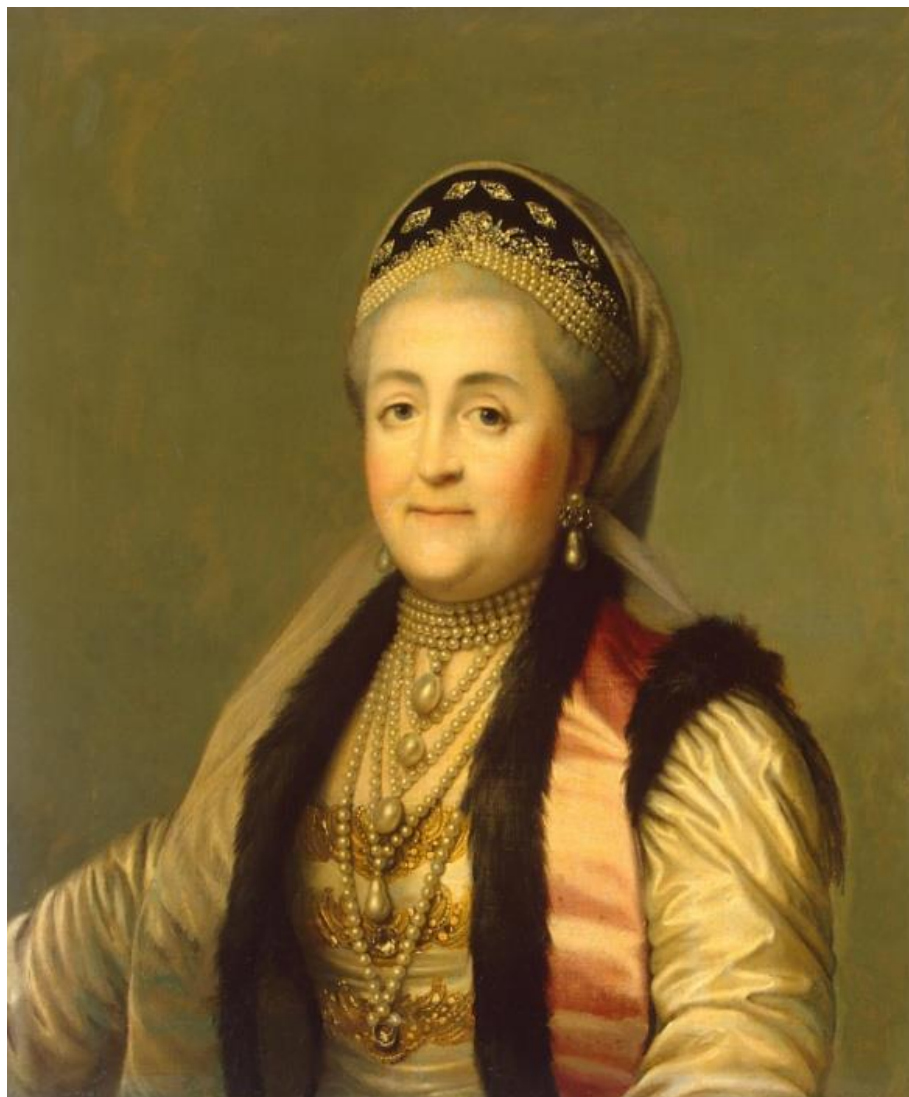
Рисунок 3. Неизвестный художник сер. XIX в. Портрет Екатерины II в шугае и кокошнике (копия с оригинала В. Эриксона). ГЭ

В то же время существует портрет Екатерины II в русском платье, принадлежащий кисти С. Торелли, где связь с маскарадом специально подчеркнута: императрица держит в руках обычную темную карнавальную маску [6, с. 147].