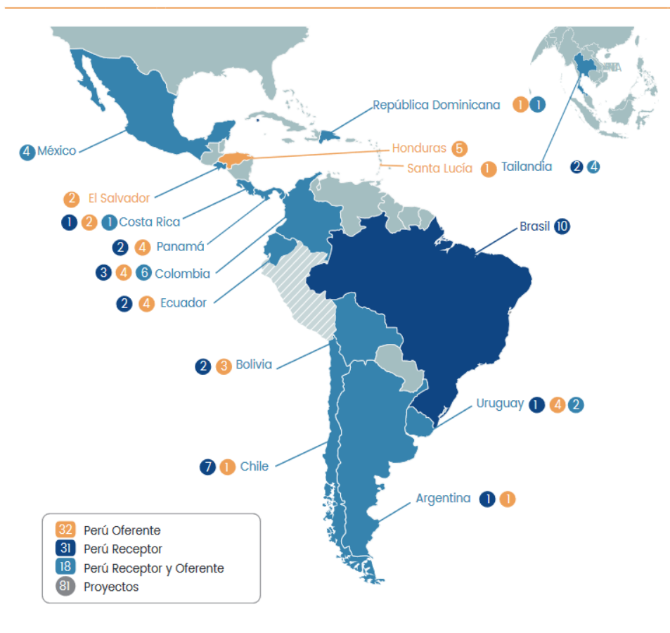
Рисунок 2. Проекты в рамках программы Сотрудничества Юг-Юг 2020 г., проекты Перу