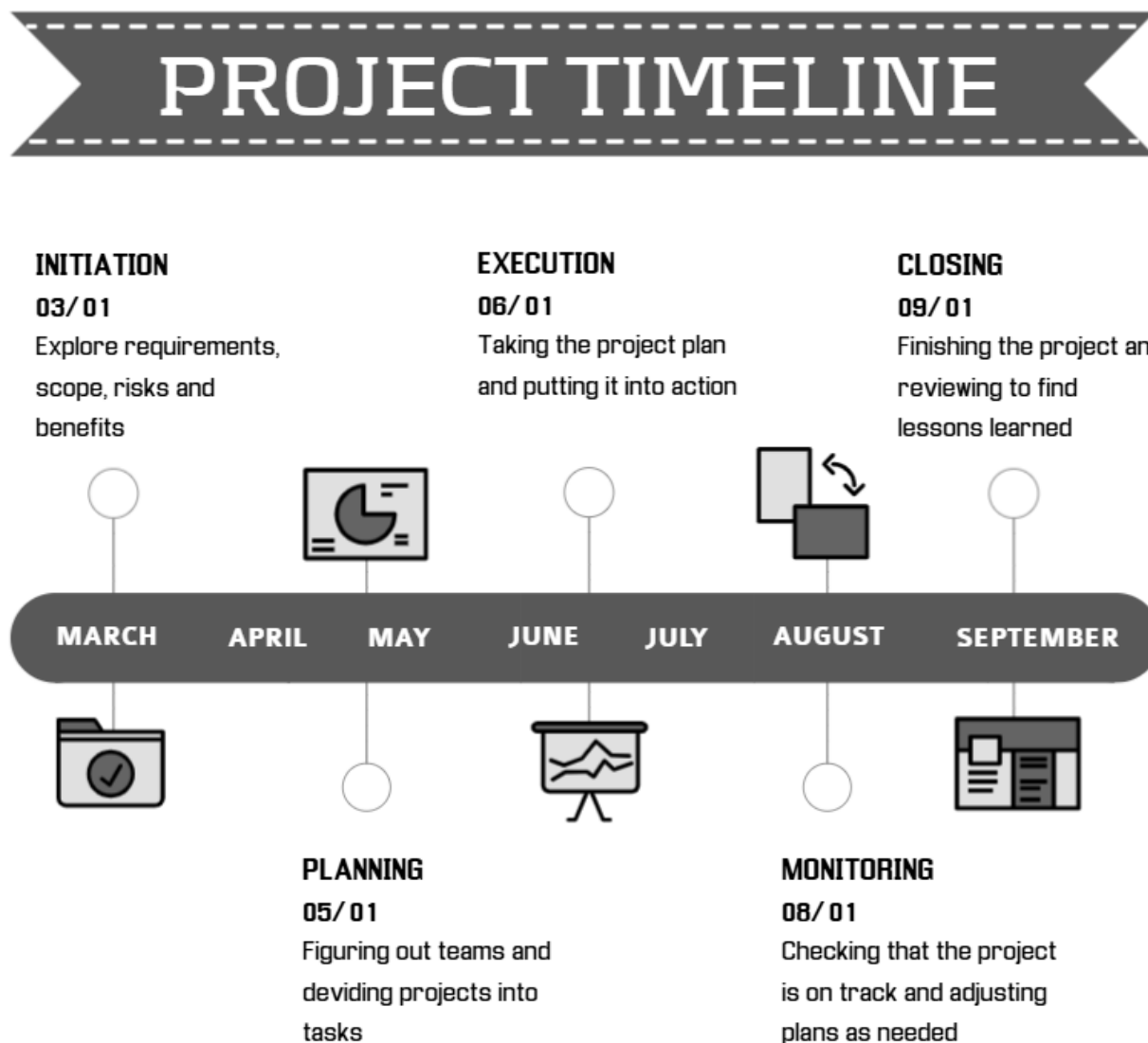
Рисунок 2. Таймлайн проекта

Как и другие виды визуализации, таймлайн обладает рядом преимуществ, а именно помогает структурировать информацию, наглядно представить последовательность событий во времени, что способствует их лучшему запоминанию, повысить мотивацию к изучению тех или иных тем за счет привлекательности изображений.