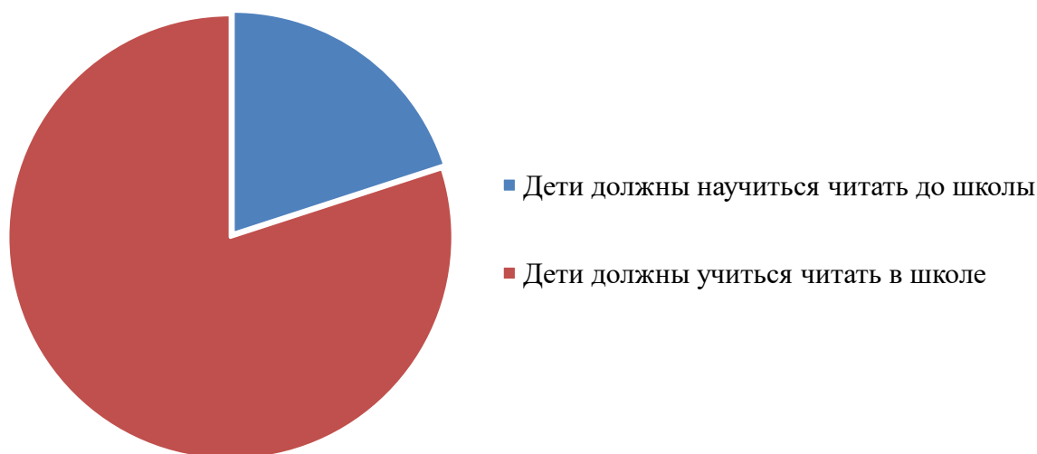
Рисунок 2. Должны ли дети научиться читать до поступления в 1 класс?

А еще с тем, что яркие и объемные буквы-игрушки стоят дорого, и далеко не каждый детский сад может приобрести их в каждую группу, а уж в семье точно такую возможность найдут не все. И тогда мы решили сделать эти игрушки с моей сестрой первоклассницей, ребятами ее класса и их родителями. Мы решили, что если мы подарим красивые и объемные игрушки-буквы в группы детского сада, то интерес к изучению алфавита возрастет и возрастет детский интерес к научению чтению.