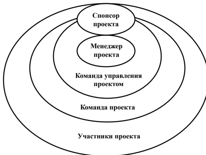
Рисунок 1. Участники проекта [3]

Ключевыми лицом, ответственным за правильность, достигаемость, результативность и сдачу проекта в срок, отвечает менеджер проекта. В то время как спонсор проекта, отвечает за гарантию того, что проект не будет остановлен в процессе деятельности из-за нехватки денежных средств и иных ресурсов (рисунок 2).