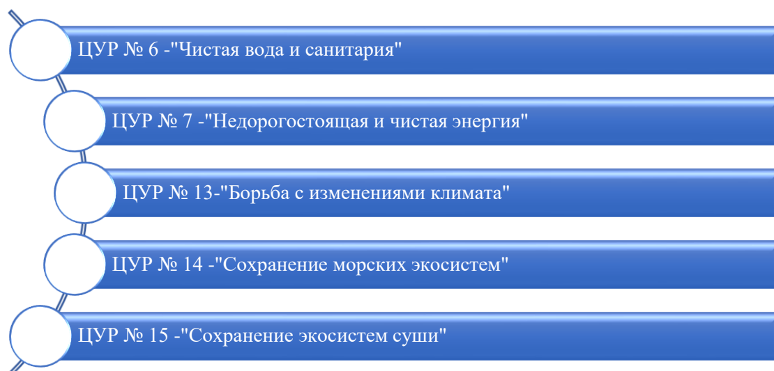
Рисунок 2. Цели развития экологической устойчивости [2, с. 23-28]

разнообразия. Спустя 10 лет, в 2002 г., состоялся Всемирный саммит ООН по устойчивому развитию в Йоханнесбурге, подтвердивший приверженность международного сообщества принципам устойчивого развития. Тем не менее, наибольшего значения достигло событие 2015 г. – утверждение «Повестки в области устойчивого развития до 2030 года», включившей в себя 17 целей устойчивого развития (рисунки 2 и 3) [2, с. 23].