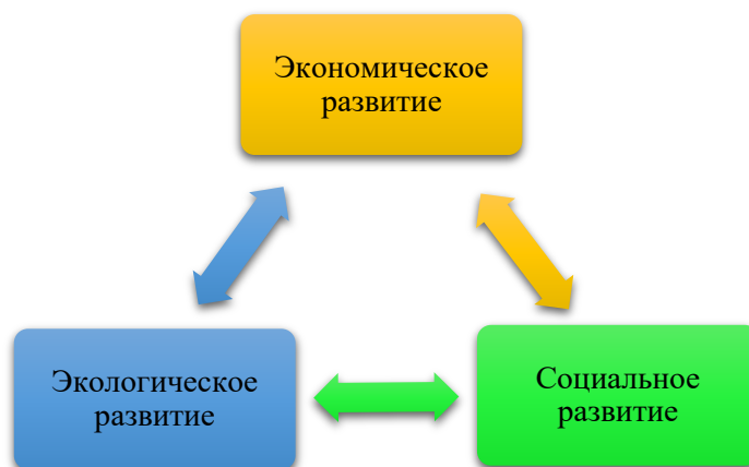
Рисунок 1. Ключевые составляющие устойчивого развития [2, с. 22]

Следующим важным шагом стала Конференция ООН по окружающей среде и развитию, прошедшая в Рио-де-Жанейро в 1992 г.. Она подчеркнула всемирный интерес к вопросам устойчивого развития и способствовала утверждению Декларации, содержащей 27 основополагающих принципа, программы действий «Повестка дня на XXI век», а также двух ключевых международных соглашений касательно климата и сохранения биологического