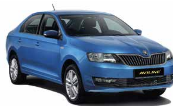
Škoda Rapid (2020-)