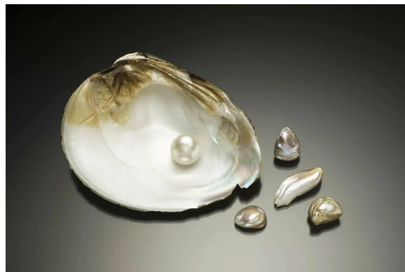
Гуанин, «жемчужная эссенция» (лат. Guanine ) органогенный минерал