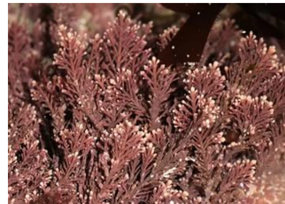
Кораллина целебная, красная водоросль (лат. Corallina officinalis )