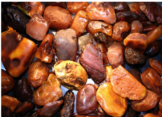
Янтарь, янтарный порошок (лат. Amber )