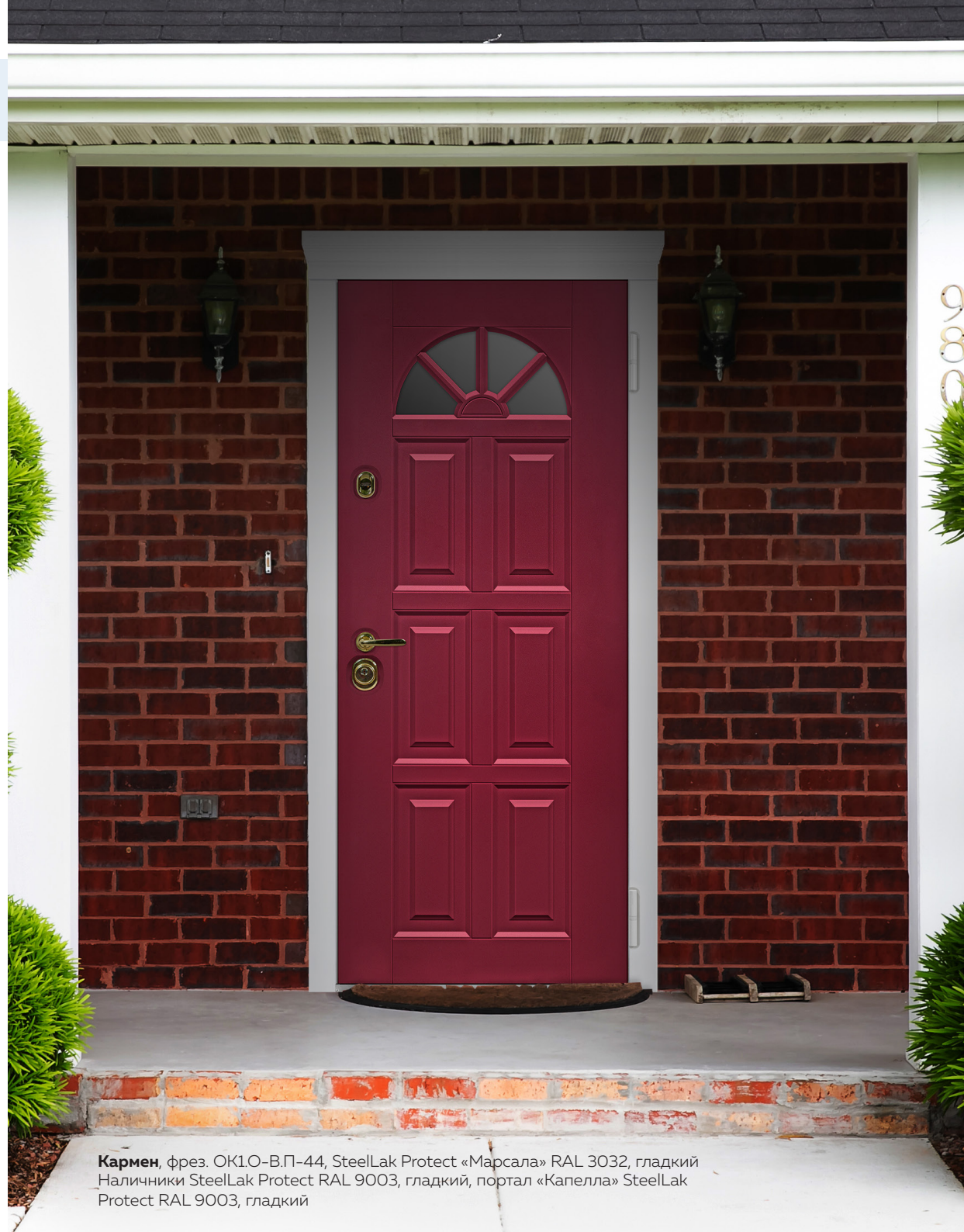
Кармен , фрез. ОК1.0-В.П-44, SteelLak Protect «Марсала» RAL 3032, гладкий Наличники SteelLak Protect RAL 9003, гладкий, портал «Капелла» SteelLak Protect RAL 9003, гладкий