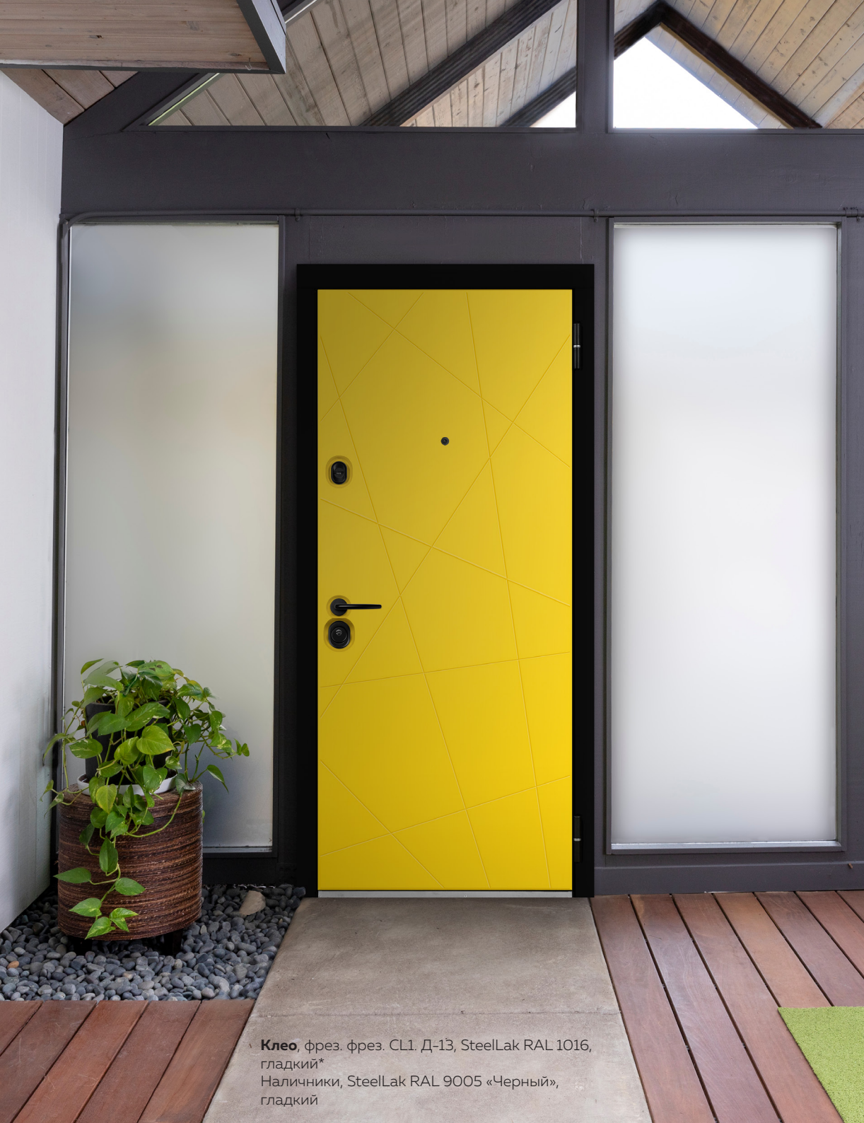
Клео, фрез. фрез. CL1. Д-13, SteelLak RAL 1016, гладкий* Наличники, SteelLak RAL 9005 «Черный», гладкий