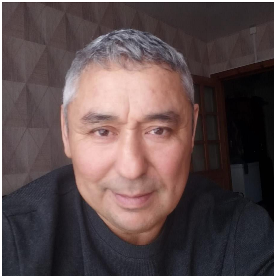
Рисунок 1. Поэт Эдуард Корнилов