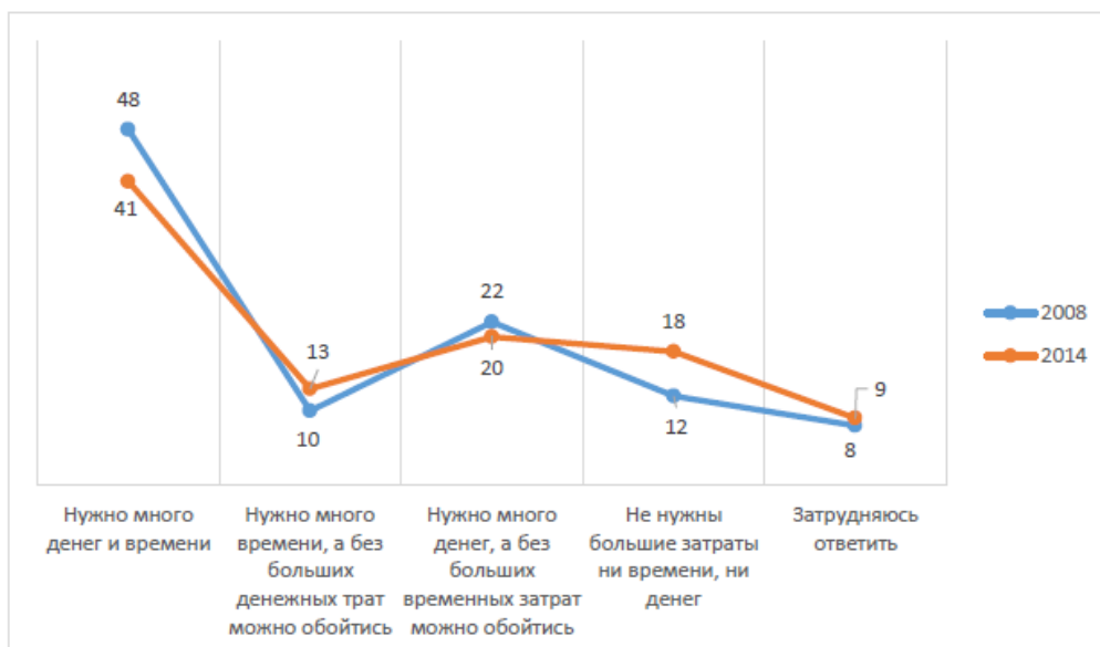
Рисунок 1. Отношение россиян к здоровому питанию. По результатам исследования ФОМ

Как справедливо указывает в этой связи Л. М. Вартанова, высокая стоимость здоровой еды связана с обострившейся проблемой продовольственной безопасности и распространением различных форм неполноценного питания. Изменить эти негативные тенденции в масштабах страны помогут специальные программы продовольственной и финансовой помощи для малообеспеченных граждан, а также нацеленная на импортозамещение последовательная поддержка российских производителей продуктов питания [1].