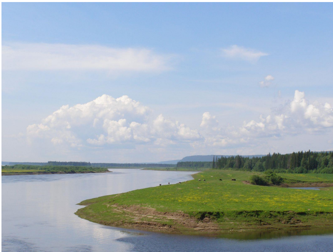
Рисунок 2. Природа Якутии.

Главная тема творчества Эдуарда Корнилова – любовь к Олёкминскому краю, верность и преданность близким людям, нелёгкому труду рабочего человека. Самобытный талант поэта раскрылся в тонком понимании мировосприятия лирического героя, в задушевном описании родной природы (рис. 2), в метафоричности языка (см. Приложение 1).