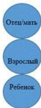
Рисунок 1. Три эго-состояния личности. Источник: [3, с. 21]

Основоположником теории о трёх эго-состояниях является американский психолог Эрик Берн (1910 – 1970). В ходе исследований он обнаружил, как меняется голос пациентов в зависимости от историй, которые они рассказывают. Изучению феномена эго-состояний были посвящены такие работы Э. Берна, как «Люди, которые играют в игры», «Трансактный анализ в психотерапии: системная индивидуальная и социальная психотерапия», «Психика в действии», «Структура и динамика организаций и групп».