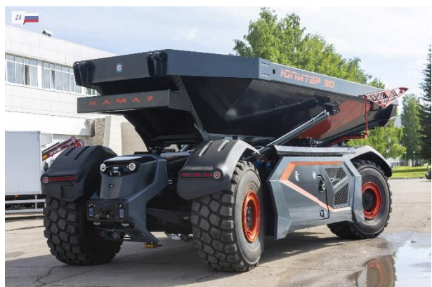
Беспилотный самосвал «КАМАЗ Юпитер 30»