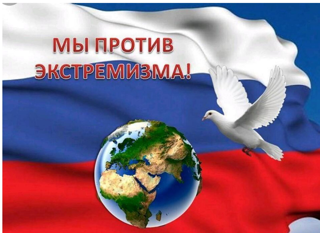
Рисунок 1. Плакат «Мы – против экстремизма!»