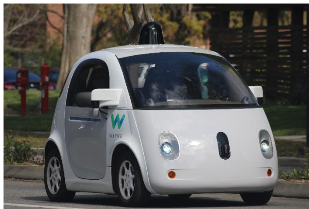
Беспилотный автомобиль компании «Waymo»