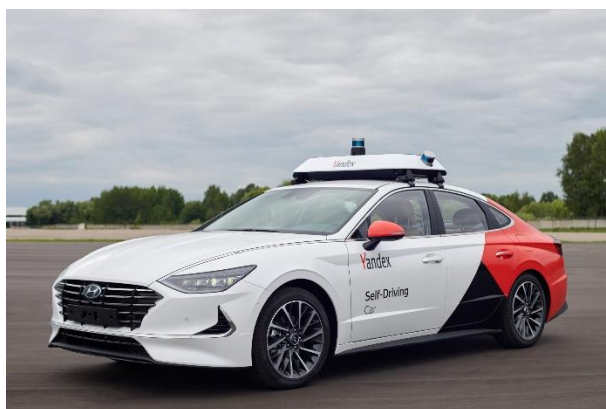
Беспилотное такси «Яндекс» на базе «Hyundai Sonata»