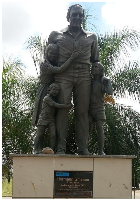
Рисунок 1. Памятник Герману Гмайнеру в боливийском городе Санта-Крус-де-ла-Сьерра.

Это поможет им социализироваться, восстановить свое эмоциональное состояние, а в дальнейшем – найти достойное место в обществе. Следовательно, необходимо создать такое учреждение, где дети, даже не будучи усыновленными, чувствовали бы себя как дома, в окружении ставших близкими для них людей, словно бы они находятся в полноценной семье.