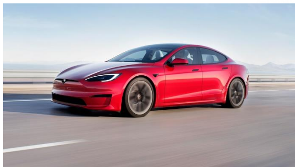
«Tesla Model S» с элементами автоведения