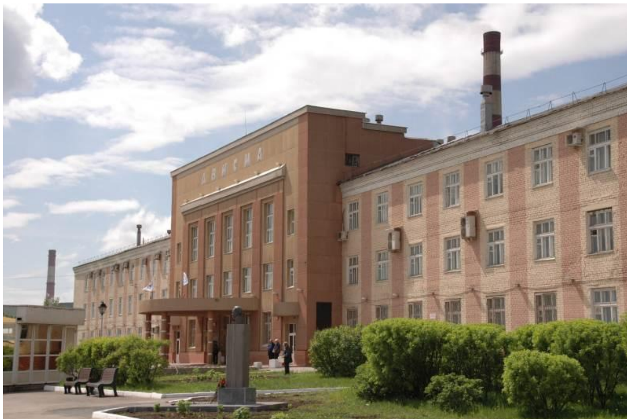
Рисунок 1. Титано-магниевый комбинат АВИСМА в Березниках.

Уже 22 июня 1943 года, когда ещё вовсю шло строительство, завод начал свою работу. Как пишут сотрудники Березниковского историко-художественного музея, «металл отливали практически под открытым небом – среди строительных котлованов, при отсутствии вспомогательных цехов, которые вступили в строй только позже» [7]. Сырьё (магний, калий) поставлялось на завод с местных рудников в Березниках. 1 018 заводских работников получили впоследствии медаль «За доблестный труд в годы Великой Отечественной войны 1941 – 1945 гг.».