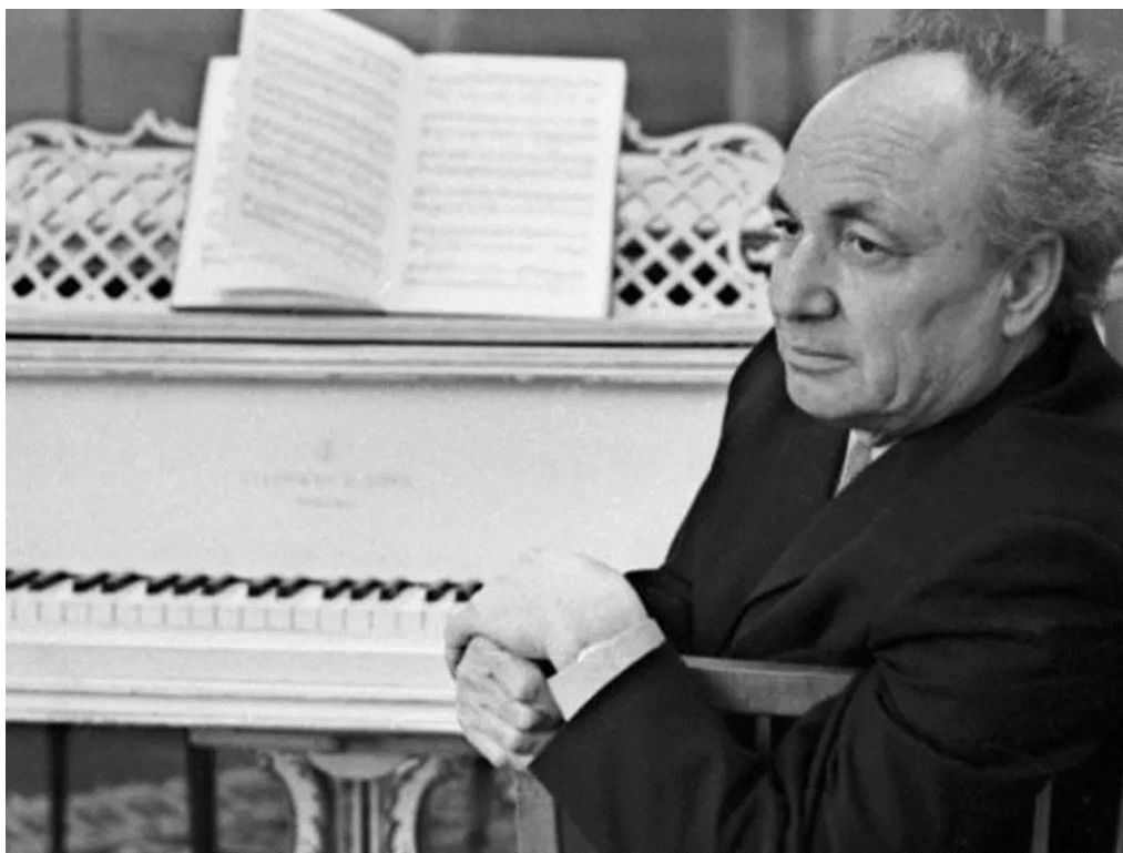
Рисунок 1. Композитор Назиб Жиганов (1911 – 1988)

Интенсивность развития в экспозиции первой части Одиннадцатой симфонии сохраняется и в быстрой коде, где ритмические фигуры (ритм «две шестнадцатых + восьмая») сопровождают стремительное движение с неустойчивым тональным планом. Используемая при этом авторская трактовка тонального плана формы характерна для постклассического формообразования.