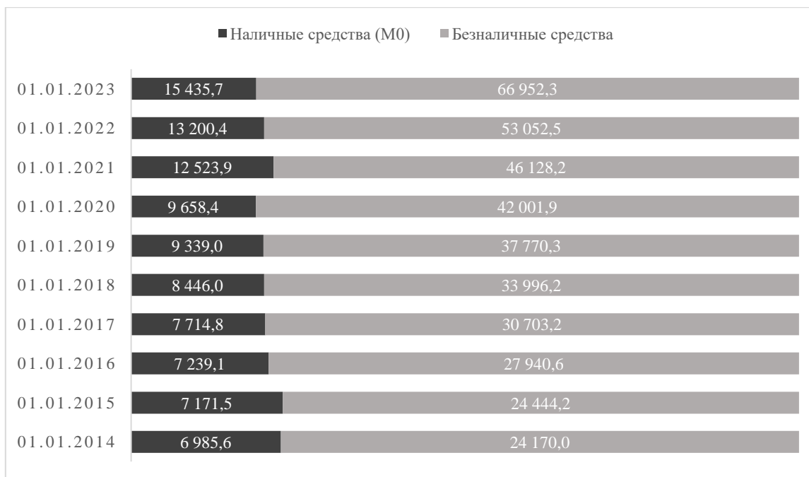
Рисунок 1. Доля наличных денег (M0) и безналичных средств в общем объеме денежной массы (M2), млрд. руб. Разработано авторами на основе [14]

Вскоре после создания своей инновационной технологии компания DigiCash обанкротилась, однако ее разработки послужили основой для дальнейшего развития системы электронных денег [16].