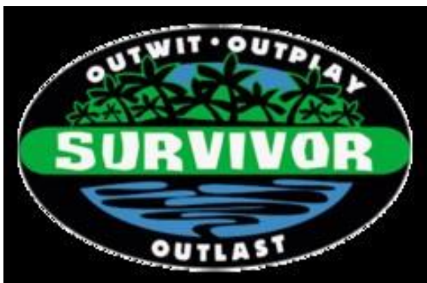
Рисунок 1. Логотип первого сезона шоу «Выживший»

31 мая 2000 года на американском канале CBS ( Columbia Broadcasting System ) прошла премьера культового сериала «Выживший» (« Survivor ») (рис. 1). Его прообразом стало шведское игровое шоу «Экспедиция Робинзон» (« Expedition Robinson »), вышедшее на телеэкраны в 1997 году.