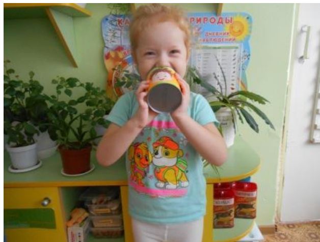
Стаканчики для крика