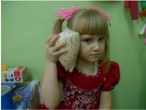
Коллекции морских ракушек