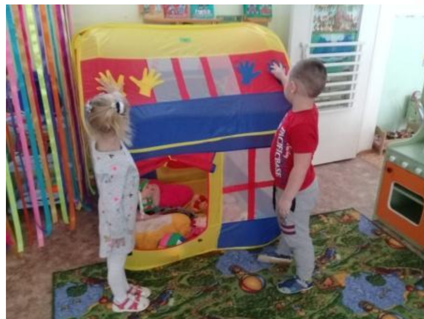
Уголок для уединения «Домик дружбы»