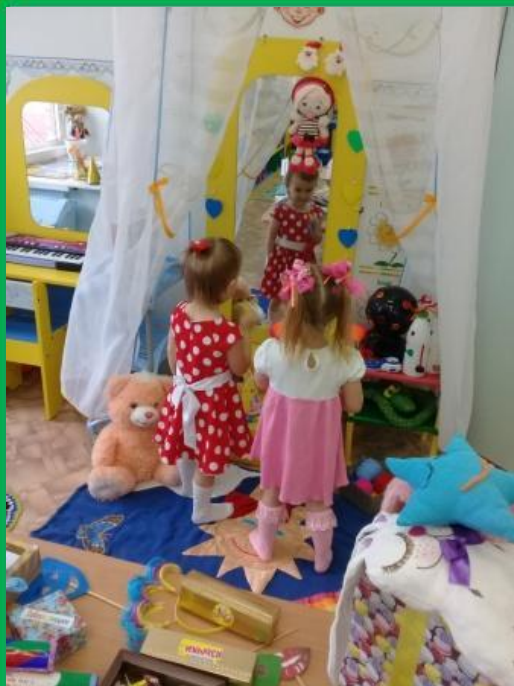
Пособия для снятия негативных эмоций