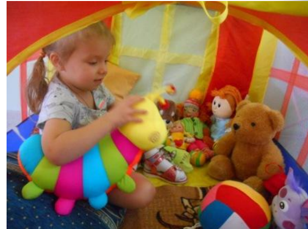
Предметы для расслабления и релаксации