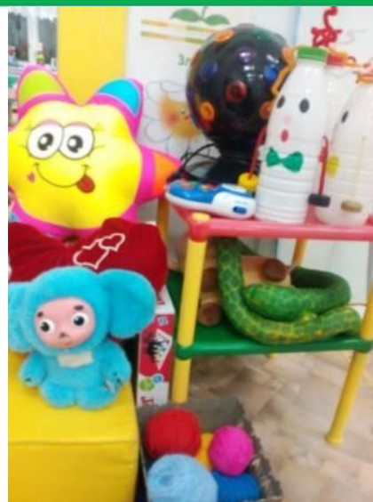
Набивная змея, пластиковые бутылки с песком для снятия напряжения