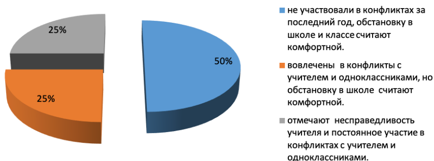
Рис. 3. Результат диагностики младших школьников по опроснику «Конфликты в школе»).

Результаты диагностики младших школьников по опроснику «Конфликты в школе» представлены на рисунке 3.