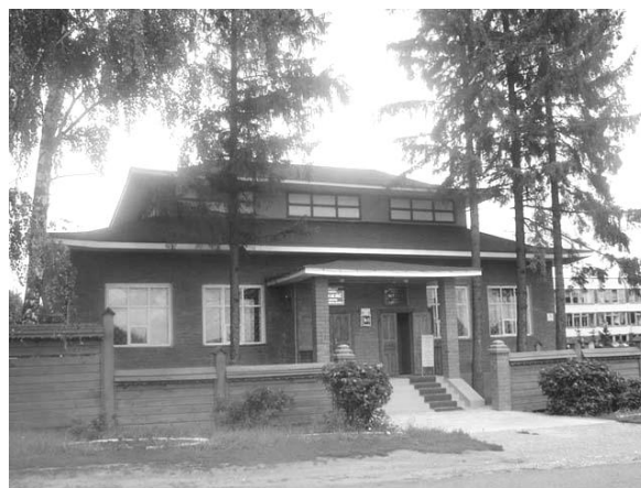
Рисунок 1. Музей «Бичурин и современность», п. Кугеси, Чувашская Республика

Научные труды Бичурина не имеют себе равных в мировой синологии. Многие из них увидели свет и принесли ему не только признание в России, но и европейскую славу.