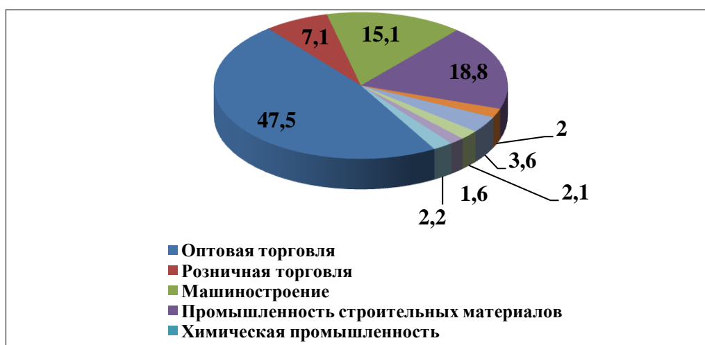
Рисунок 2. Отраслевая структура выручки наиболее динамично развивающихся компаний крупного бизнеса юга России в 2009 г.

Как показывают данные диаграммы, изменение стоимостной доли компаний различной отраслевой принадлежности в совокупном объеме выручки формирует новый отраслевой профиль перспективных зон потенциального роста экономической эффективности региональной экономики.