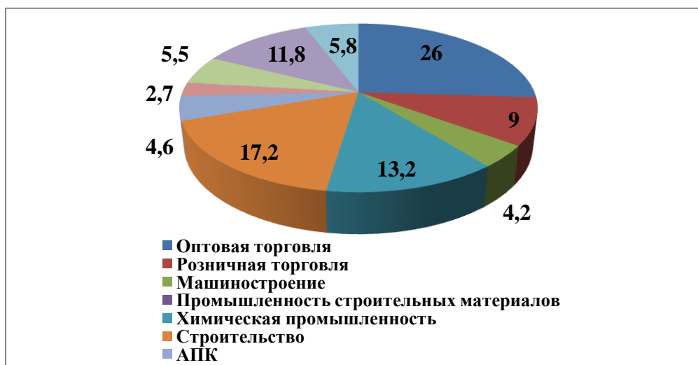
Рисунок 1. Отраслевая структура выручки наиболее динамично развивающихся компаний крупного бизнеса юга России в 2007 г.