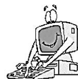
Рисунок 1. Интерфейс программного обеспечения факультативного курса по web-дизайну

Заключение. В современной образовательной среде назрела острая необходимость построения такой системы дополнительного образования в области информатики и информационных технологий, которая будет опираться на научную основу. Но, к сожалению, из-за специфики современных информационных технологий опыт построения дополнительного образования в других предметных областях не может быть механически перенесен по ряду причин.