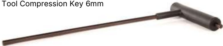
Tool Compression Key 6mm