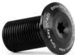
Merrow fork V3 IHC Compression Screw