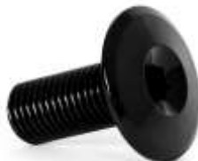
Legoin fork V2 IHC Compression Screw