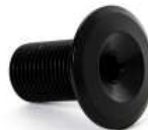
Legoin fork V2 SCS HIC Compression Screw