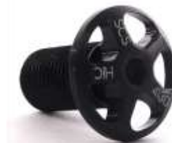
Merrow V2 Compression Screw