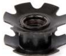
Starnut ICS 10