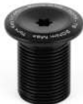
Merrow fork V3 SCS HIC Compression Screw