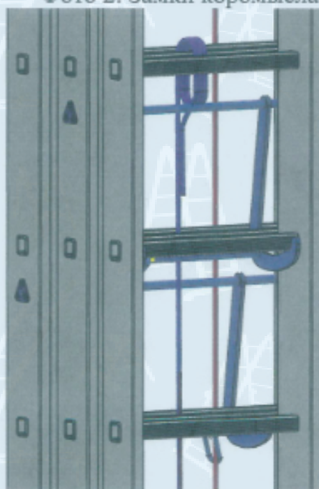
Фото 2: Замки коромысла

На концах лестницы сверху и снизу установлены пластиковые башмаки. На широкой секции внизу установлены прорезиненные башмаки для лучшего сцепления с поверхностью.