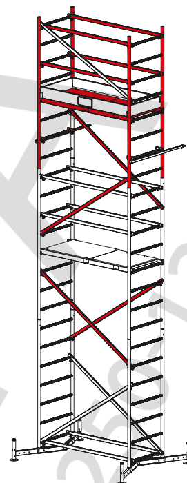
+ 2-я надстройка № арт. 710154 + 1-я надстройка № арт. 710130 Базовая конструкция № арт. 710116