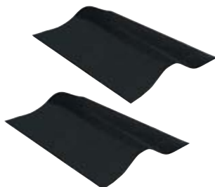
Комплекующий элемент NonSlip (2 шт.)