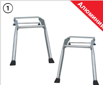
Узел BoardStand (2 шт.)