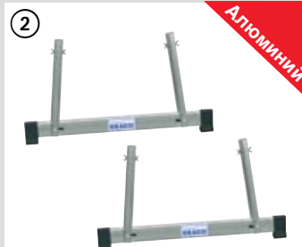
Узел TeleSet (2 шт.)