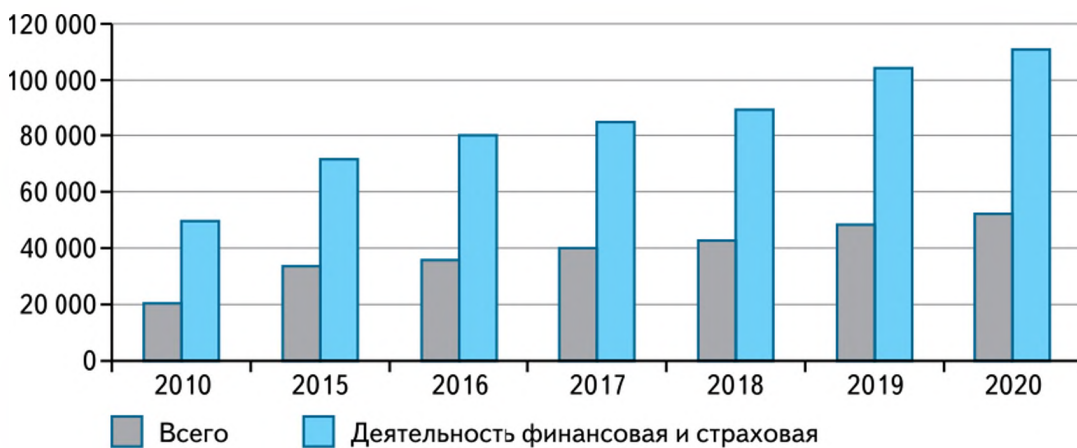
Динамика среднемесячных начисленных номинальных заработных плат (до уплаты налогов), руб.

Почему номинальная заработная плата у работников, связанных с финансовой и страховой деятельностью, выше, чем в целом в экономике страны?