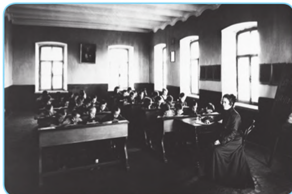
М. П. Дмитриев. На уроке в церковно-приходской школе. 1912 г.

Используя материалы СМИ и Интернета, узнайте, чему учили в церковно-приходских школах.