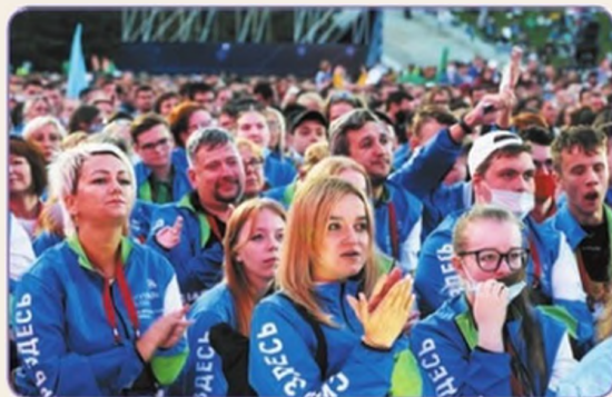
Участники финала национального чемпионата «Молодые профессионалы». 2021 г.

Найдите в Интернете материалы о молодых победителях национального и международного чемпионатов профессионального мастерства. Какие качества их отличают?