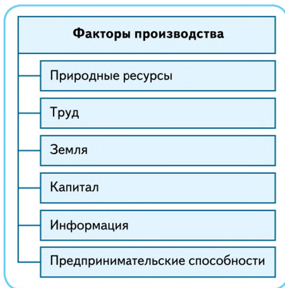
Рис. 8.1. Факторы производства товаров и услуг

Рынок ресурсов ещё называют рынком факторов производства. Факторами производства называется та часть ресурсов, которая необходима для осуществления процесса производства (рис. 8.1).