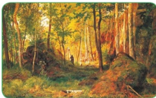
Пейзаж с охотником. Валаам. И. И. Шишкин

В чём вы видите особенность отображения художниками природных объектов?