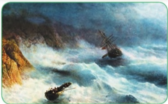
Буря у мыса Айя. И. К. Айвазовский