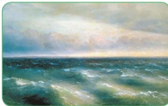
Чёрное море. И. К. Айвазовский