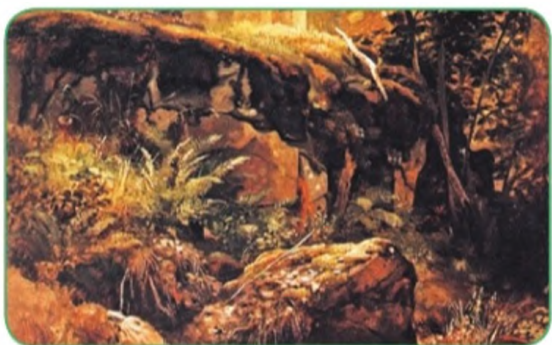
Камни в лесу. Валаам. И. И. Шишкин