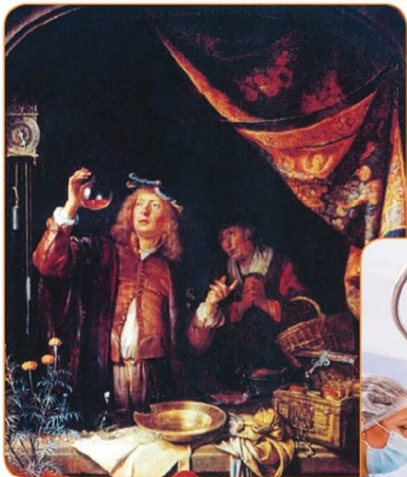
Врач. 1675 г. Санкт-Петербург. Эрмитаж. Г. Дау.