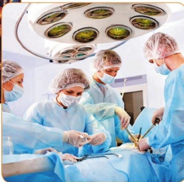
Современные хирурги в операционной

В чём вы видите прогресс в развитии медицины? Что, на ваш взгляд, способствовало прогрессу в этой области?