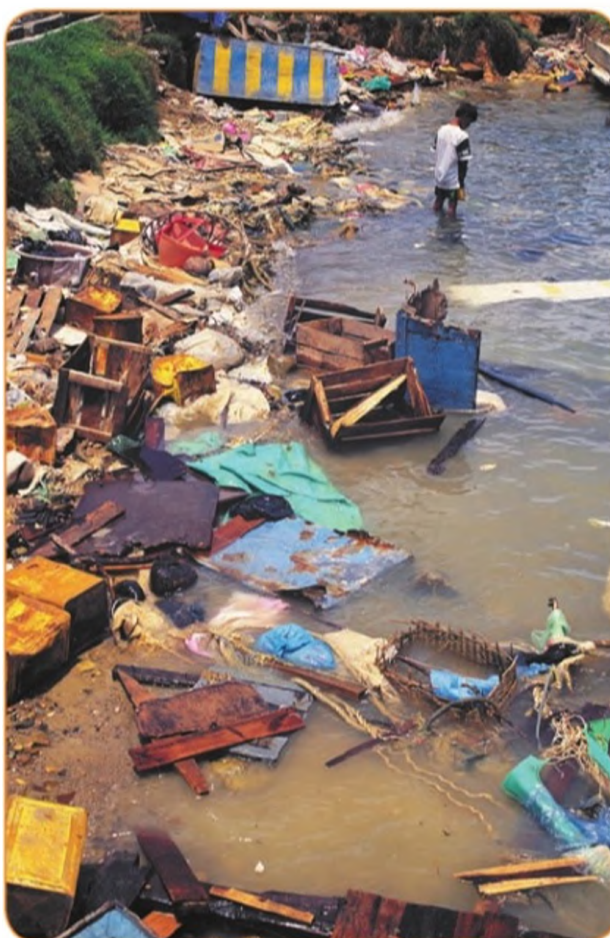
Часть рынка с мусором, сваленным в море. Борнео. Малайзия

Принятие государствами законов, направленных на охрану природы. Согласно Конституции Российской Федерации, каждый имеет право на благоприятную окружающую среду. Там же указано, что каждый должен сохранять природу, бережно относиться к природным богатствам. В нашей стране принят также специальный закон «Об охране окружающей среды».