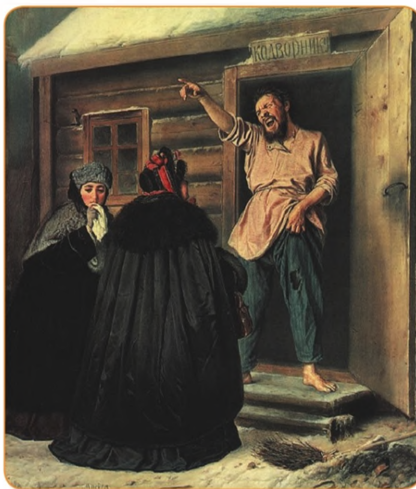
Дворник, отдающий квартиру барыне. В. Г. Перов

Обедневшие женщины, скорее всего мать и дочь, вынуждены снимать жильё в бедном районе. Рассмотрите персонажей картины. Принадлежат ли они к разным социальным группам? Почему вы так решили? Опираясь на сюжет картины, поясните утверждение: «Социальная лестница может вести не только наверх, но и вниз».