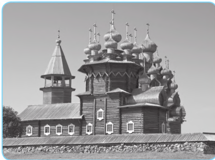
Кижы — деревянный ансамбль церквей XVIII в. Расположен на острове Кижы Онежского озера в Карелии

На основе материалов СМИ и Интернета определите, что делает это сооружение непревзойдённым памятником культуры.