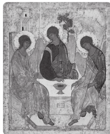
Андрей Рублёв. Троица. XV в.

Вместе с тем сколько бы исследователи ни проводили параллелей между художниками и философами (Достоевским и Ницше, Толстым и Кантом), всё свидетельствует о том, что свести философ-