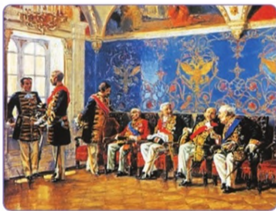
К. Е. Маковский. «В ожидании аудиенции». 1904 г.

Представители дворянской знати ждут официального приёма у лица, занимающего высокий государственный пост.