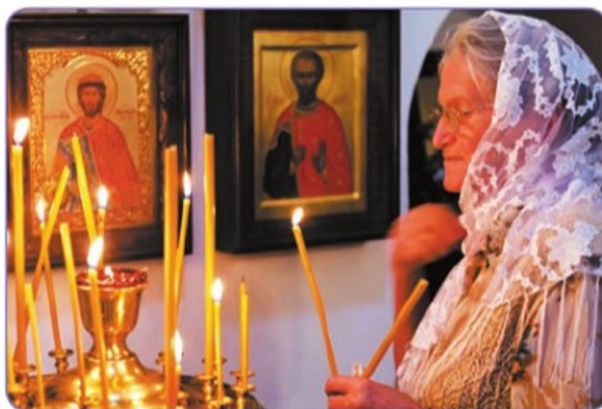
В православном храме

Какие принципы конституционного строя иллюстрируют эти изображения? Ответ поясните.