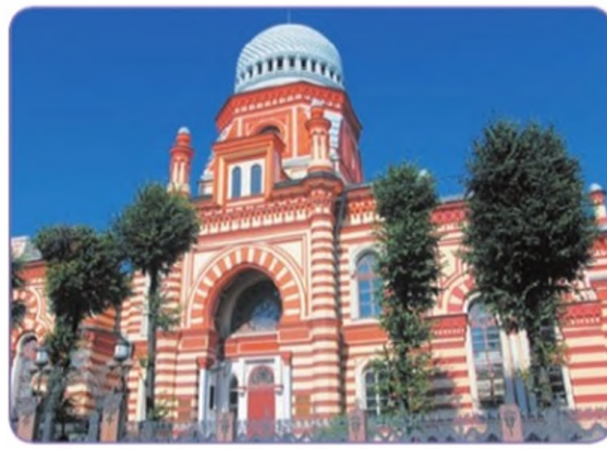
Большая хоральная синагога в Санкт-Петербурге