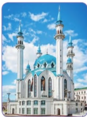
Мечеть Кул-Шариф в Казани