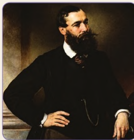
В. О. Шервуд. Портрет Б. Н. Чичерина