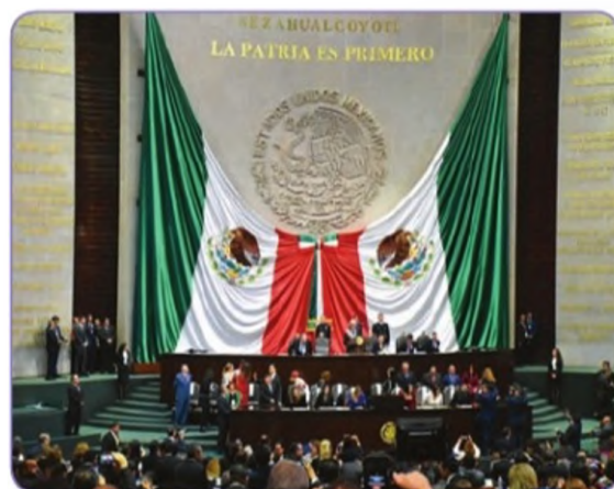
Заседание Генерального конгресса Мексики

Что объединяет изображения? Почему нужно обсуждать в парламенте различные инициативы? Аргументируйте ответ с опорой на текст параграфа.