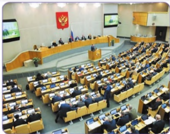
Заседание Государственной Думы Российской Федерации