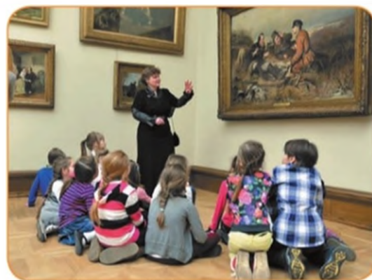
Школьники на экскурсии в музее

Чему учатся школьники на каждом из уроков, запечатлённых на фотографиях?