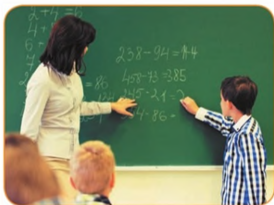
На уроке математики